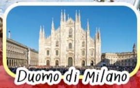
Duomo di Milano