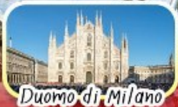
Duomo di Milano