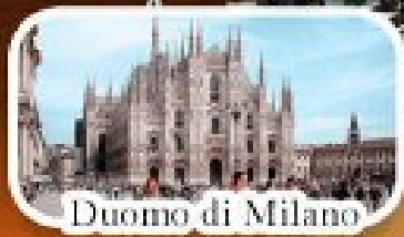
Duomo di Milano