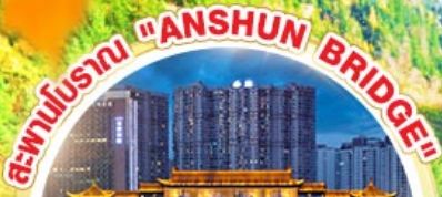
สะพานโบราณ "ANSHUN BRIDGE"