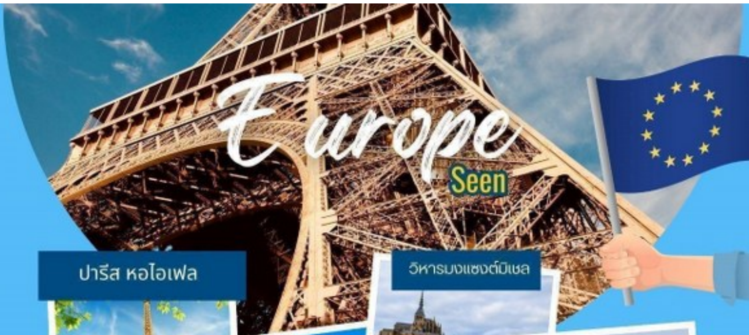
ปารีส หอไอเฟล