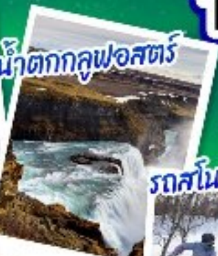
น้ำตกกุลฟอสต์