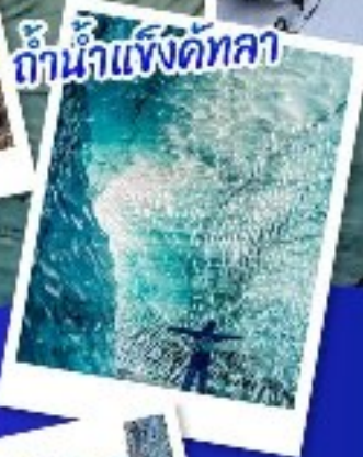
ถ้ำน้ำแข็งคัทลา