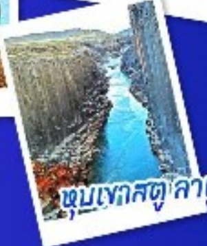
หุบเขาสตุลาเกล