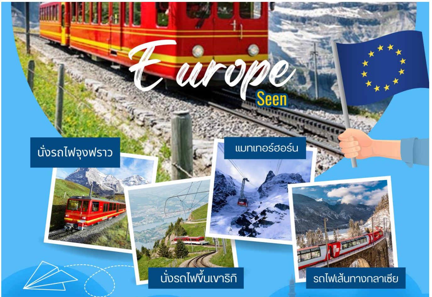
นั่งรถไฟจุงฟราว