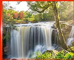
น้ำตกเพ็ญพบใหม่