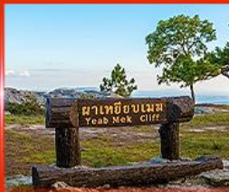
ผาเหยียบเมฆ