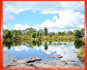
สระอินดาด