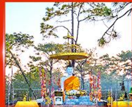
พระพุทธรูปเมตตา ลานพระแก้ว