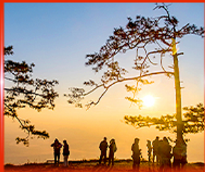
ผานกแอ่น