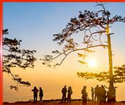
ผานกแอ่น