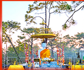
พระพุทรมตตา ลานพระแก้ว