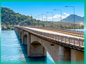
สะพานมิตรภาพลาว - ญี่ปุ่น