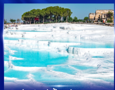
ปราสาทบุษบ้าย น้ำพุคคาเอ

OPTION JEEP SAFARI นั่งจี๊ปชมวิวคัปปาโดเกีย