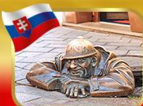
เข็ลอินคูลูมิลเมืองบราติสลาวา