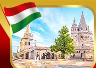
ปิ่อมชาวประมงเมืองบูดาเปสต์