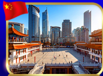
ตึกไควซิงโหล