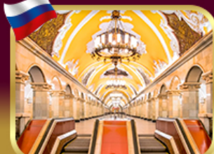
สถานีรถไฟใต้ดินกรุงมอสโก