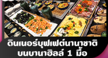
ดินเนอร์บุฟเฟ่ต์นานาชาติ บอนบานาฮิลล์ 1 มื้อ