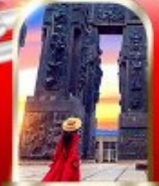
THE CHRONICLE OF GEORGIA