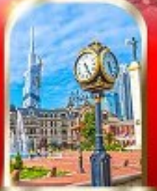
BATUMI CITY ADJARA

เมืองถ้ำอูปลิสซิคะ ■ ป้อมอนาบูชิ ■ นั่งกระเช้าชมเมืองบอร์โจมี อนุสาวรีย์มิตรภาพ รัสเซีย-จอร์เจีย ■ โอสต์เกอร์เกดี วิหารจาวารี ■ มหาวิทยาลัยสเวทิตสเวลี