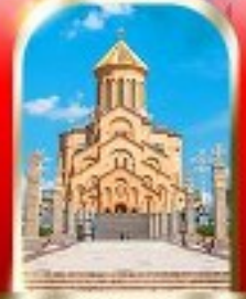
HOLY TRINITY CATHEDRAL