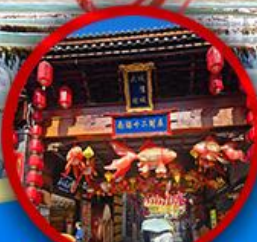
เมืองโบราณต้าลี่