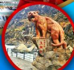
ช่องเขาเสือกระโจน