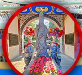
เจ้าแม่กวนอิมต้าลี่