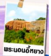
พระนอนอียาง