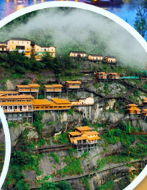
คุมเขาเทวดา