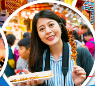
ตลาดควางจัง