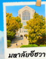
มหาชัยชีวา