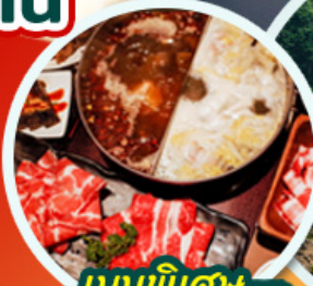
เมนูพิเศษ ชาบูหม่าล่า