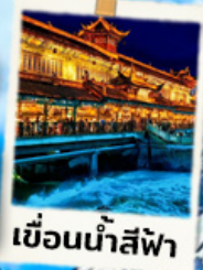
เขื่อนน้ำสีฟ้า