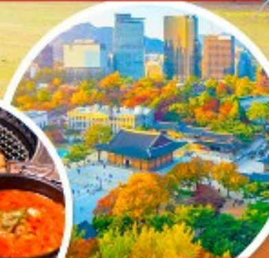
พระราชวังเคียงอกซุกง