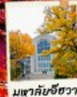
มเขาคัยชีฮวา