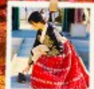
ใส่ชุดฮันบก