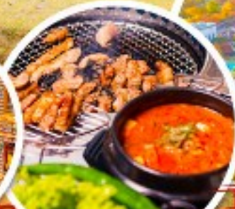
ตัวอย่างเกาหลี