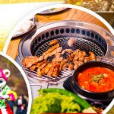
เมนูย่างเกาหลี