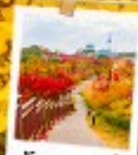
นัมซานพาร์ค