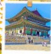
วังเคียงบกทง