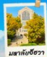
มหาชัยชิวา