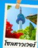
โซลทาวเวอร์