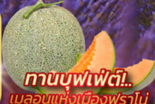
🍈 ทานบุฟเฟ่ต์! เมลอนแห่งเมืองฟุราโน่