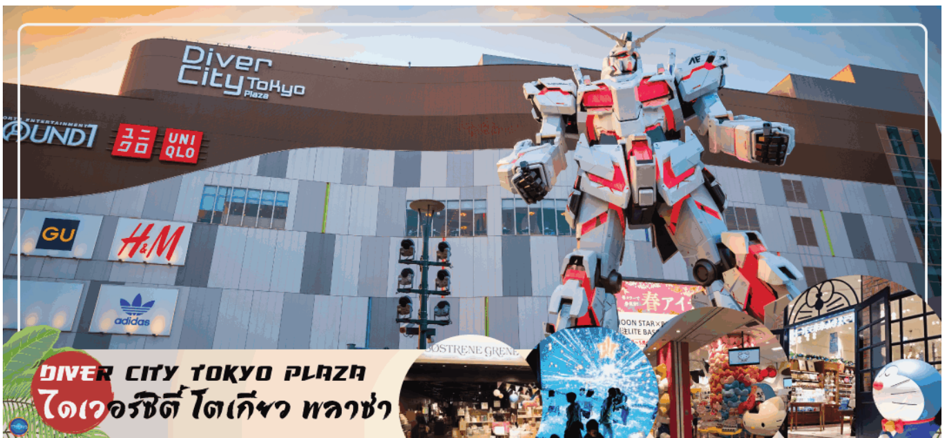
DIVER CITY TOKYO PLAZA ไดเวอร์ซิตี โตเกียว พลาซ่า

แต่ก็ยังคงความเป็นธรรมชาติไว้ด้วยความอุดมสมบูรณ์ของพื้นที่สีเขียว ไดเวอร์ซิตี โตเกียว พลาซ่า (Diver City Tokyo Plaza) เป็นห้างดังอีกห้างหนึ่ง ที่อยู่บนเกาะ โอไดบะ จุดเด่นของห้างนี้ก็คือ