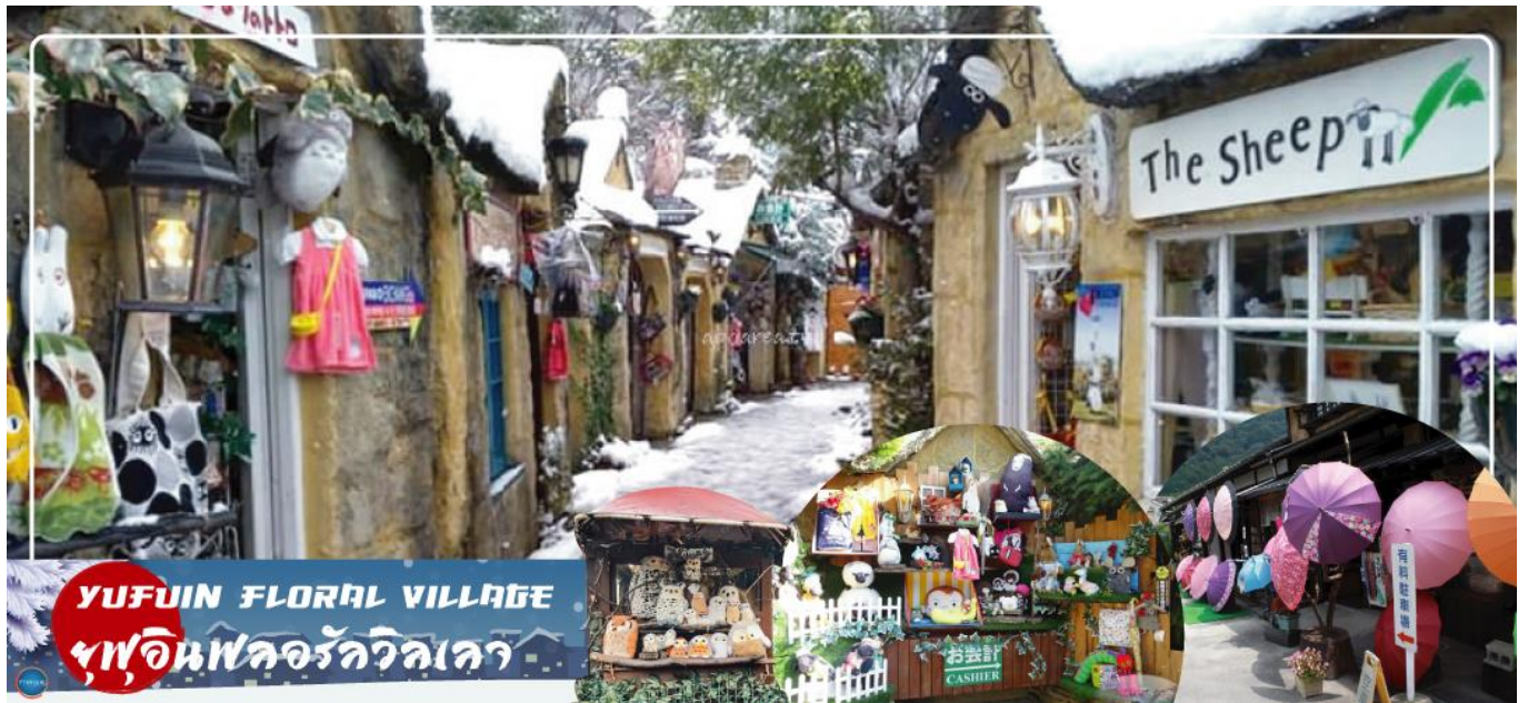
เที่ยง เลือกรับประทานอาหารกลางวัน ณ หมู่บ้านยูฟุอินตามอัตราด้อย(3) Cash Back ท่านละ 1000 เยน (จ่ายโดยไกด์พนักงาน)