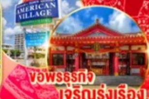
พิพิธภัณฑ์ เจ็ทริญรุ่งเรือง!