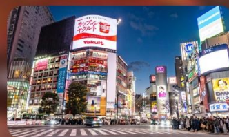
ซ้อปิ้งชินจูกุ