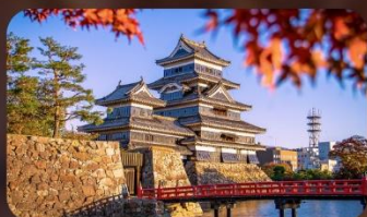
ปราสาทมัทสึโมโต้

HOTEL HEDISTAR NARITA หรือเทียบเท่ามาตรฐานญี่ปุ่น