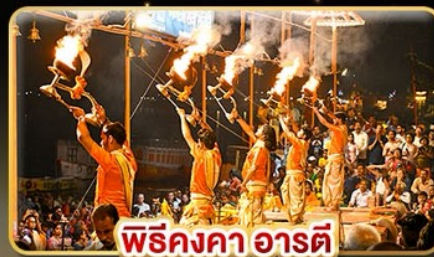
พิธีคงคา อารตี