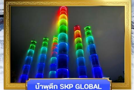
น้ำพุตัก SKP GLOBAL