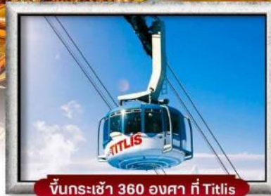
ขึ้นกระเช้า 360 องศา ที่ Titlis