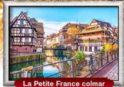
La Petite France colmar

บินหรู สายการบิน Full Service | พิเศษ! หอยแอสคาโก้