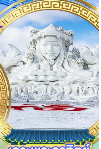
เกาะพระอาทิตย์