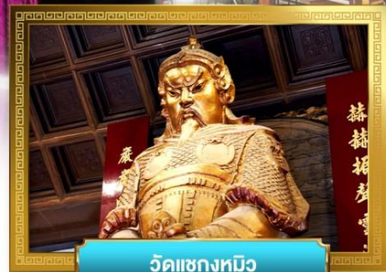
วัดเข่งทมิฬ