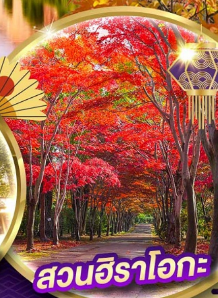
สวนอิระโอคะ