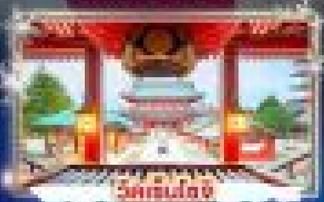
วัดชินโตจิ

เที่ยวชมงานประเพณีไฟตกน้ำ SAGAMIKO ILLUMINATION เช็กอินसानสกี ชมวิวภูเขาไฟฟูจิ