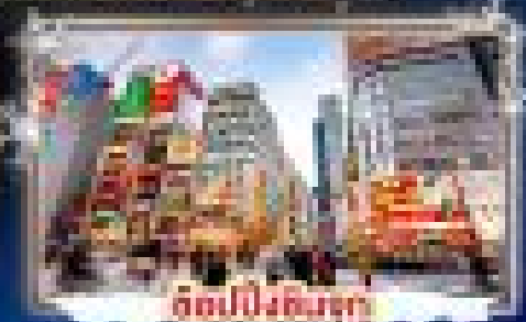
ตึปปิ้งชิบูย่า