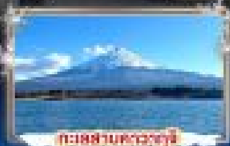
ทะเลสาบคาวะซุจิ