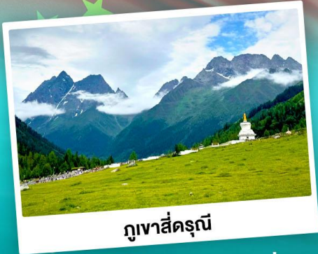
ภูเขาสิ่ดรุณี