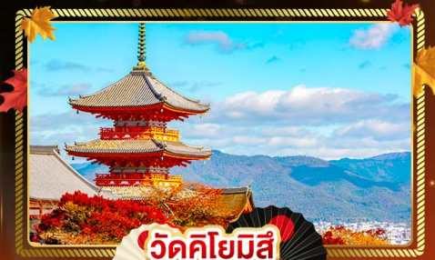
วัดคิโยมิตสึ