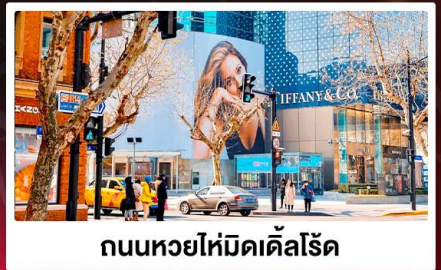
ถนนหวยไห่มีดเคิลโรด