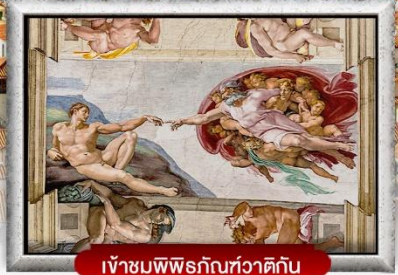
เข้าชมพิพิธภัณฑ์วาติกัน

เมนูพิเศษ! สปาเกตตีเส้นหมึกดำ, พิชซ่าสไตล์อิตาลีเย็นแท้