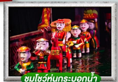
ชมโชว์หุ่นกระบอกน้ำ