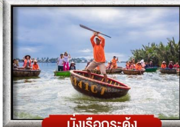
นั่งเรือกระดัง