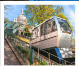
ขึ้นรางสกีมารัต