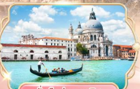
นั่งเรือสู่เกาะเวนิส