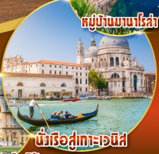
นั่งเรือสู่เกาะเวนิส