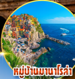
หมู่บ้านมานาโรซ่า

พิเศษ ลิ้มรสป่าร์มาแฮมถึงเมืองต้นกำเนิดแท้ๆ