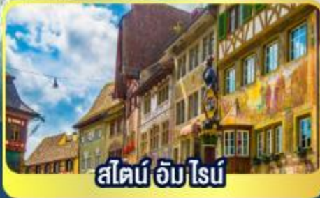
สไตน์ อัม ไรบ์