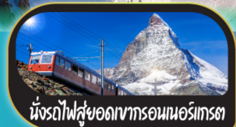
นั่งรถไฟสู่ยอดเขากรอนนอร์เกรท