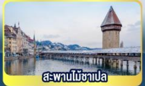
สะพานไม้ซาเปล