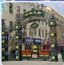
ถนนจงยาง