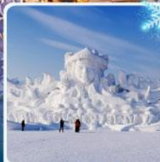
งานแกะสลัก เกาะพระอาทิตย์