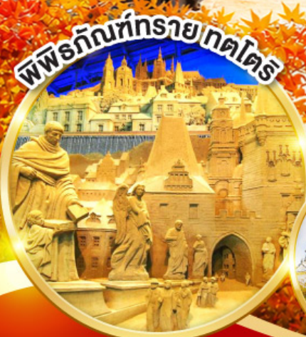
พิพิธภัณฑ์รายกตไตร