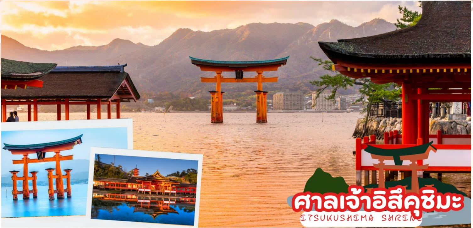
ศาลเจ้าอิสึคุชิมะ ITSUKUSHIMA SHRINE

ศาลเจ้าจะเหมือนเรือขนาดยักษ์ที่ลอยน้ำอยู่ ศาลเจ้าแห่งนี้ได้รับการขึ้นทะเบียนเป็นมรดกโลกในปี พ.ศ. 2539 และรัฐบาลญี่ปุ่นได้ยกฐานะให้เป็นสมบัติประจำชาติ