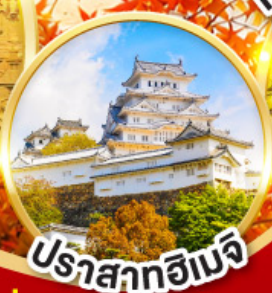
ปราสาทโอเมจิ