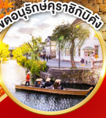
เขตอนุรักษ์คุราชิกิบิคัง