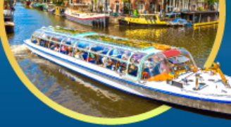
ล่องเรือนครอัมสเตอร์ดัม