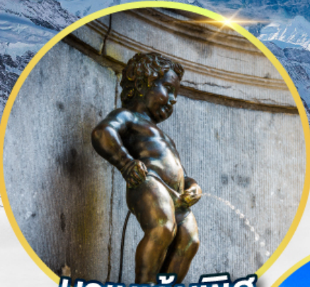
มานกันพิส