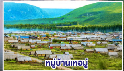
หมู่บ้านเหมอู๋