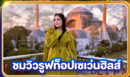
ชมวิวยูพีทือปเซเวนฮิลส์