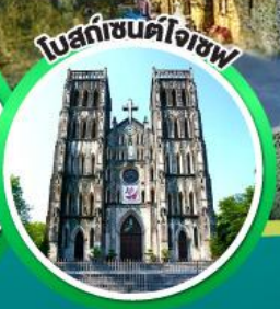
โบสถ์เซ็นต์โจเซฟ