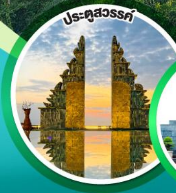
ประตูลสุวรรณค์