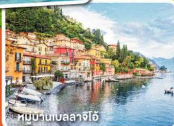
หมู่บ้านเบลลาจีโอ